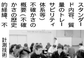
計測技術講習会 同氏は、工業技術院の出身で、標準供給技術室長、計量標準管理官として、計測の歴史の構築、運